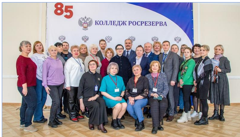
На фото официальные лица и почётные гости юбилейного события. О мероприятиях, связанных с юбилеем НИИПХ читайте на стр. 8.

На протяжении многих лет колледж и НИИПХ поддерживают прочные дружественные связи, поэтому не случайно 20 марта на площадке образовательного учреждения стартовали мероприятия, посвященные 85-летию со дня образования Научно-исследовательского института проблем хранения Росрезерва. Именно это событие, привлёкшее внимание не только к деятельности учреждения-юбилера, но и к нашему колледжу, следует считать главным событием весны 2024 года.